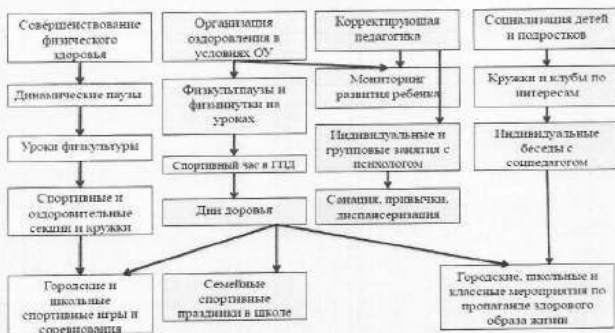
Схема оздоровительной работы учащихся 1-4 классов

Реализация этого направления зависит от администрации образовательной организации учителей физической культуры, психологов, а также всех педагогов.